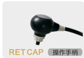
RET CAP 操作手柄